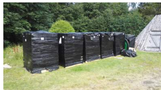
Travar med underlag som väntar på att läggas ut

-Det kan bli en fin mötesplats för både ortsbefolkningen och turister, säger en av dom som varit inblandad i projektet.