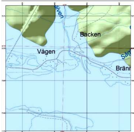
Strandnivåkartan av SGU över delta vid Kvarnbergsvatnet 10 000 år sedan.