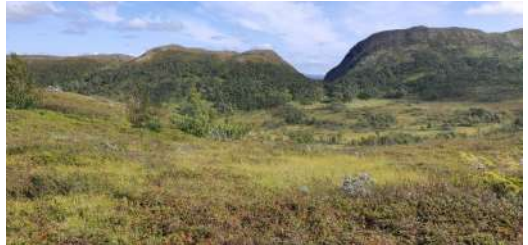
Portfjället med dess utmärkande tektoniska dal som enligt Ångeby 1954 fördjupades och vidgades genom glaciala rörelser